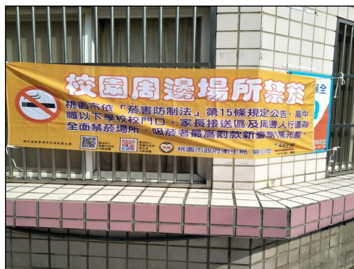
活動說明：校區反菸布條宣導