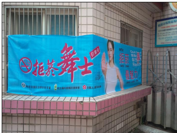
活動說明：校區反菸布條宣導