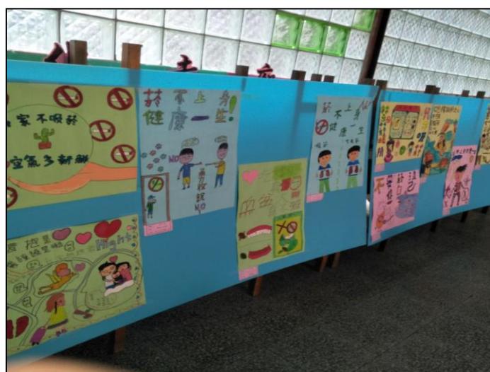
活動說明：六年級菸害防制海報展